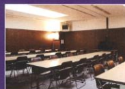
会食会場にも使える多目的室

故人がやすらぎの天空へと誘われるようお願いを込め開設された「やすらぎ天空館」は、大阪市で初めての葬儀・葬祭専門施設です。駅前前の立地や設備の充実さで人気があり、一般的な個人葬から大規模な社葬等にも利用頂けます。今回この「やすらぎ天空館」を利用した社葬にも対応できる高級祭壇をご用意いたしました。ぜひご利用ください。