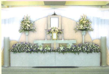
パッケージ料金 48万円(税別)