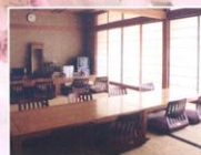
ゆったりとくつろげる親族控室