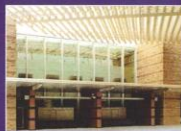
暖かみのある淡い色合いの外観

本社 〒545-0062 大阪市阿倍野区阿倍野4丁目4番1号 TEL.06-6623-0042 FAX.06-6623-0342