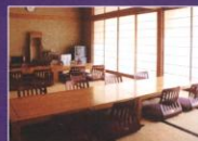
ゆったりとくつろげる親族控室