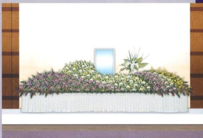
パッケージ料金 200万円(税別) サイズ/W7,200×H2,800