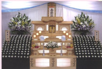
パッケージ料金 78万円(税別)