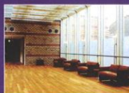
明るさいっぱいのやすらぎコーナー