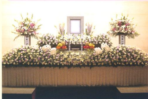
パッケージ料金 98万円(税別)