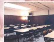
会食会場にも使える多目的室