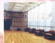
明るさいっぱいやすらぎコーナー