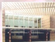
暖かみのある淡い色合いの外観